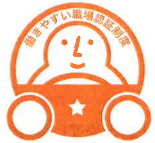
「一つ星」認証マーク

申請受付・認証業務は、国土交通省から、本制度の実施団体に選定された「一般財団法人日本海事協会（通称：ClassNK）」が行います。