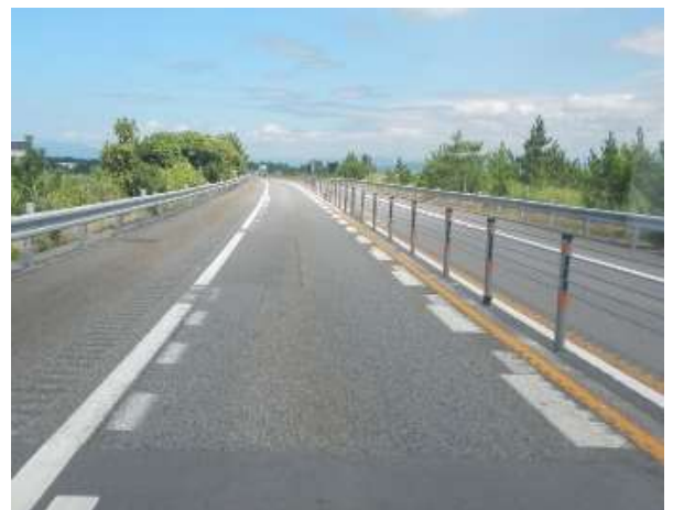
ワイヤロープの設置イメージ