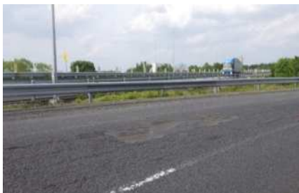
宇都宮上三川IC入口ランプ 舗装損傷状況

安全・快適に高速道路をご利用いただくために必要な工事ですので、ご理解とご協力をお願いします。