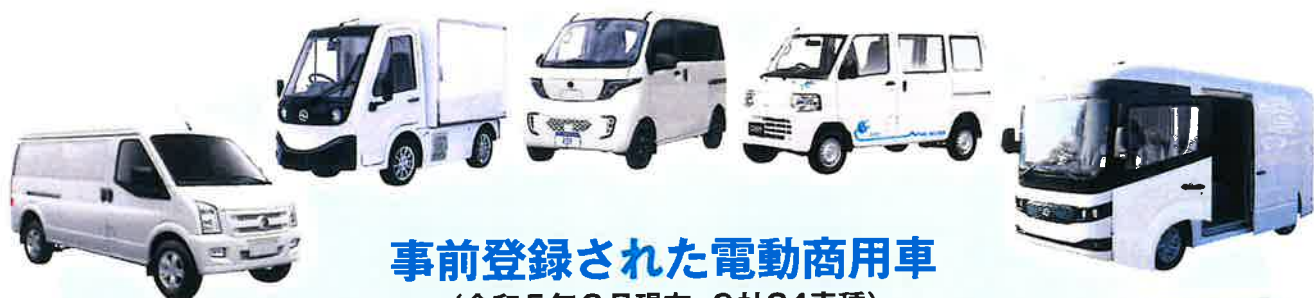
事前登録された電動商用車