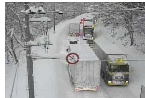
【写②】R3.12.28 国道7号の交通混雑状況