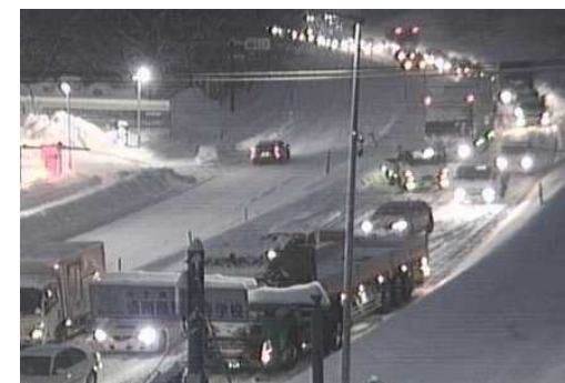
【写④】R5.2.1 国道4号の交通混雑状況