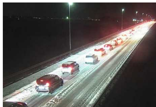
【写③】R4.1.4 国道7号の交通混雑状況