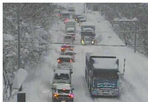
【写①】R3.12.27 国道4号の交通混雑状況